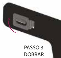
PASSO 3 DOBRAR