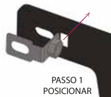
PASSO 1 POSICIONAR