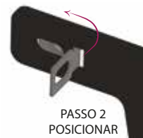
PASSO 2 POSICIONAR