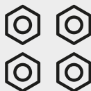
4 - Porcas M8x1,25