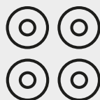
2 Arruelas M8 larga